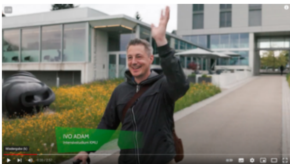
Video Weiterbildung am KMU-HSG

Unser neues Weiterbildungsvideo zeigt Ihnen, was eine Lernreise am KMU-HSG so einzigartig macht.