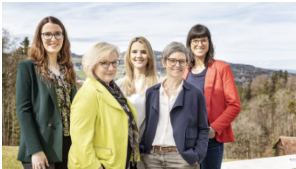
Ihr Weiterbildungsteam freut sich auf Sie!

Sind Sie eine unternehmerische Persönlichkeit und suchen Inspiration?