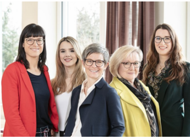
Die sehr engagierten Seminarleiterinnen unseres Weiterbildungsteams

Neben diesen Tagungen laufen und liefern im Praxis-Hauptgeschäft des Instituts, also etwa beim Intensivstudium KMU oder beim St.Galler Managementseminar für KMU die letzten Blöcke vor der Sommerpause. Deshalb für alle, die gerne den Überblick behalten, hier der Link zu allen Weiterbildungsangeboten des Instituts .