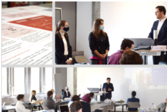
Lehrveranstaltung «Corporate Entrepreneurship»