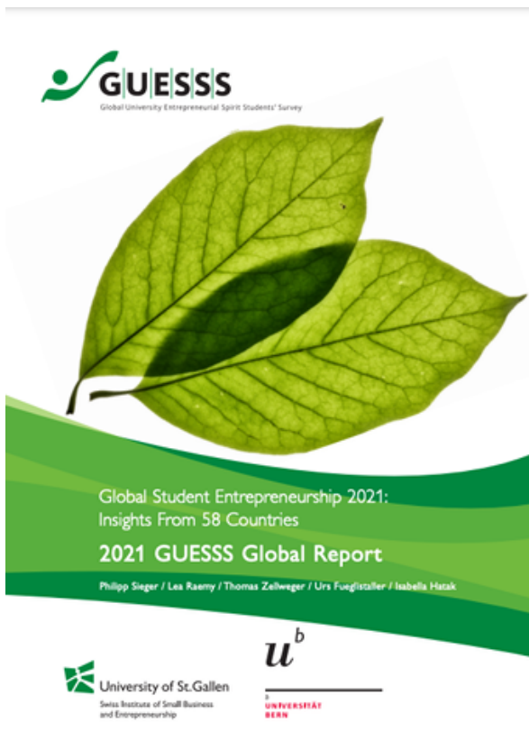
GUESSS Report 2021

Seit 2003 führen wir in regelmässigen Abständen die GUESSS-Studien durch, eine sehr breit angelegte Studie zur unternehmerischen Einstellung von Studierenden. Der neue Bericht 2021 basiert auf einer Befragung von 267'000 (!) Studierenden in 58 (!) Ländern.