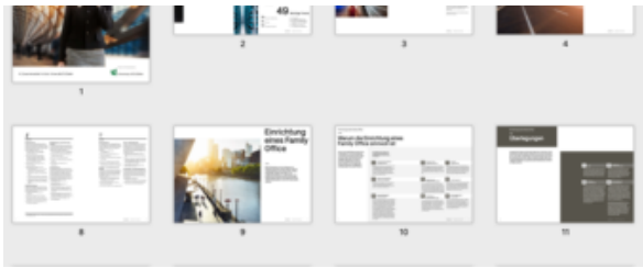
White Paper Single Family Offices

Verbreitung von Family Offices bietet die Publikation einen umfassenden Überblick über den gesamten Weg eines Family Offices: von der ersten Vision über den Aufbau bis hin zum Betrieb und den Trends, die die Zukunft von Family Offices prägen.