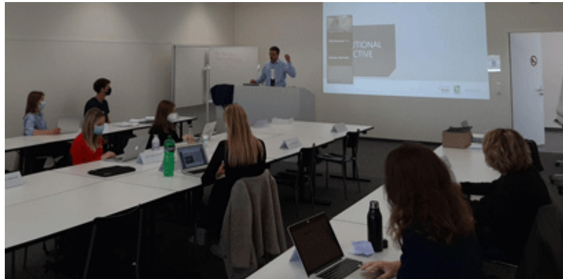
Lehrveranstaltung «Family Business»

Impressum: KMU-HSG – CFB-HSG Universität St.Gallen Dufourstrasse 40a CH-9000 St.Gallen