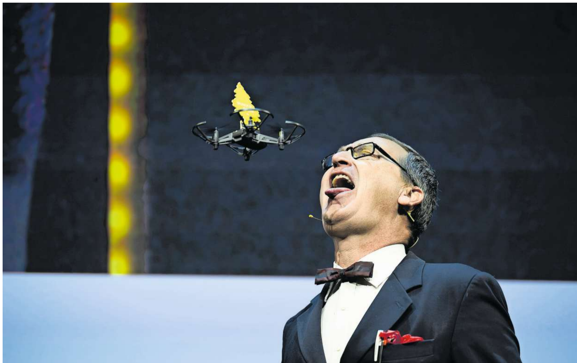
Das Duo Lapsus sorgte zwischendurch für frischen Wind.

n – zu jeder Zeit, an jedem Ort. Verantwortliche in kleineren und mittleren Unternehmen sind dabei le die Weichen ihres Unternehmens in eine erfolgreiche Zukunft stellen. Wie das geht, was hilft diskutiert. 1200 Führungskräfte aus Wirtschaft, Politik und Kultur waren in der Olma-Halle 9 dabei.