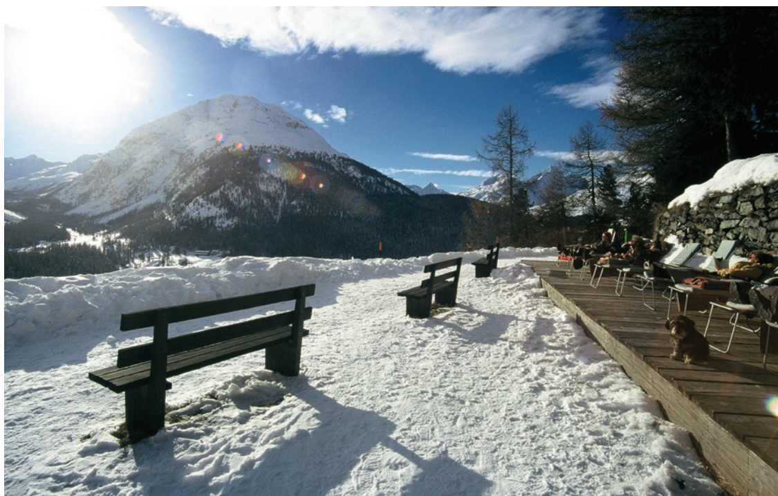
Pontresina war wiederum Gastgeber für das KMU-Circle Forum HSG