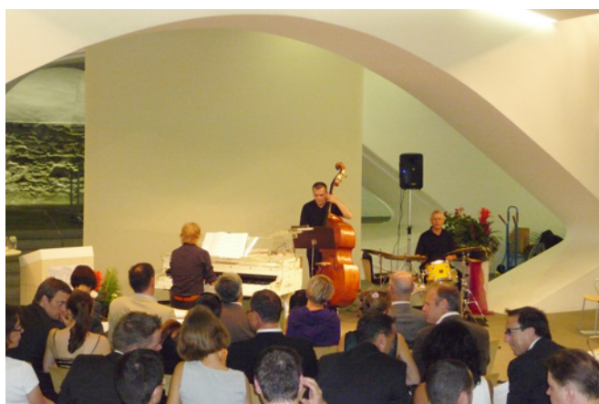
Intensivstudium 18. Durchführung Herbst 2009: 44 glückliche Absolventen konnten an diesem Festakt ihr Diplom entgegennehmen.

Auch diese Durchführung wird ausverkauft sein.