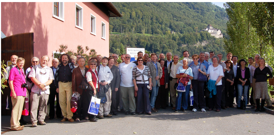
Gruppenbild – Rencontres de St-Gall 2006 in Wildhaus

Die Tagungsbeiträge zu den Rencontres 2006 sind – wie die meisten Forschungsberichte des Instituts – frei im Web verfügbar: www.kmu.unisg.ch > Forschung und > Publikationen