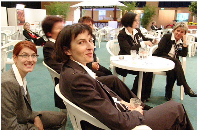
KMU-Tag 2006 – Die Damen des Instituts

Spezielle branchenspezifische Studien wurden durchgeführt über das Agrarfreihandelsabkommen EU-Schweiz für mittelgrosse Hersteller sowie eine Kurzstudie über den Hafnermarkt der Schweiz.