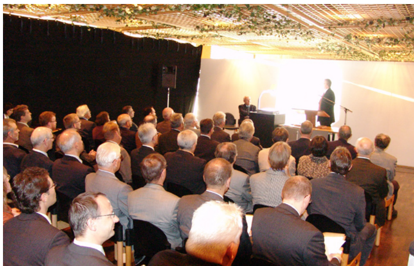
KMU-Tag 2006 – GV Förderungsgesellschaft