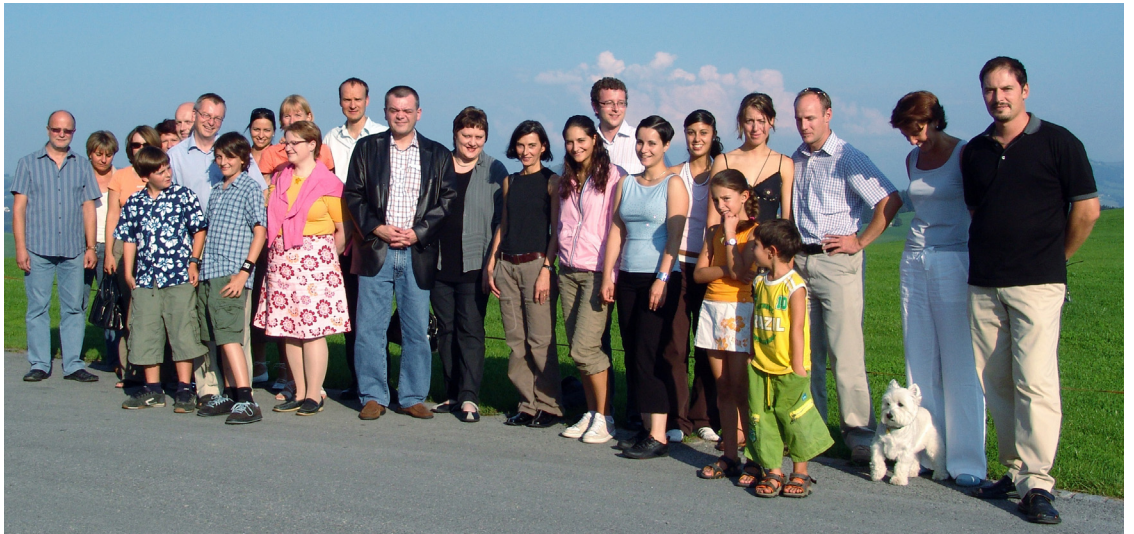
Gruppenbild anlässlich eines Institutsausflugs samt Familienangehörigen, Rechberg (bei Herisau), 1. Sept. 2005